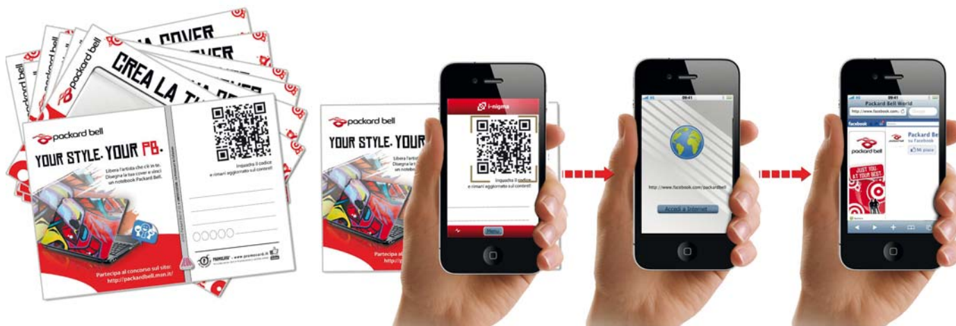
PACKARD BELL - Tramite QR-Code si accede alla pagina Packard Bell World su Facebook (versione mobile) che da accesso al concorso promosso dalle cartoline.