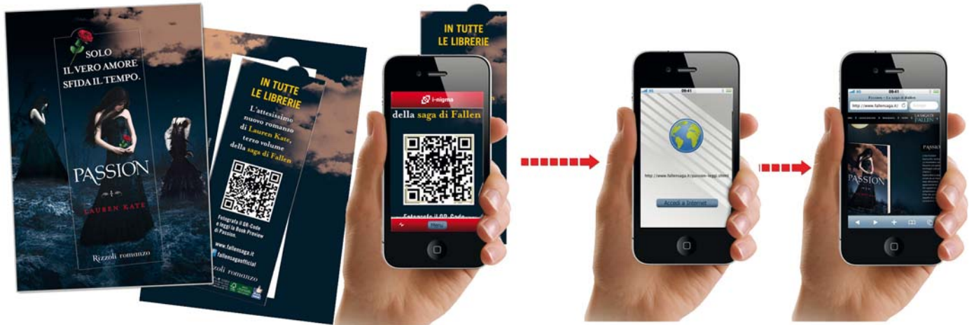
RIZZOLI - Tramite QR-Code si accede ad una pagina d'atterraggio dove poter leggere e scaricare in formato pdf la BookPreview del romanzo Passion , terzo libro della saga Fallen .