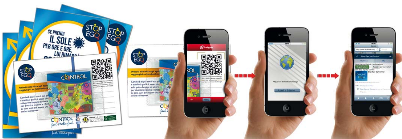
CONTROL - Tramite QR-Code si accede alla Fanpage di Control Stop Ego su Facebook (versione mobile).