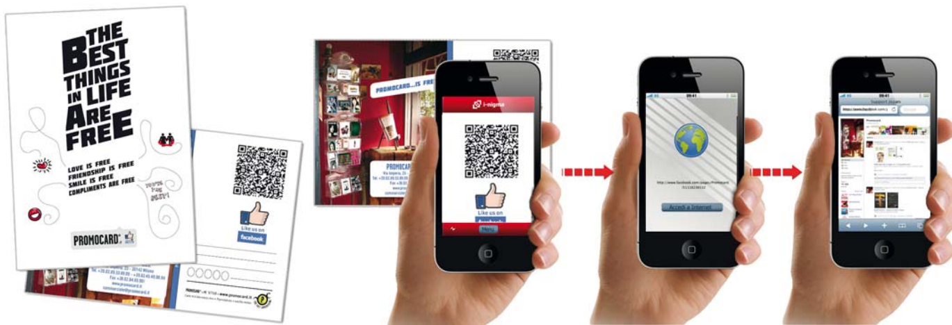
PROMOCARD - Tramite QR-Code si accede alla Fanpage di Promocard su Facebook (versione mobile).