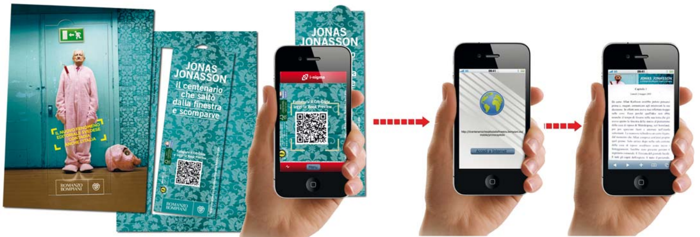
BOMPIANI - Tramite QR-Code si accede direttamente alla versione mobile della BookPreview del romanzo Il centenario che saltò dalla finestra e scomparve .