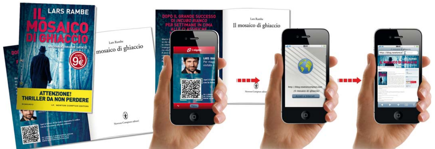
NEWTON COMPTON EDITORI - Tramite QR-Code si accede ad una pagina d'atterraggio dove poter leggere e scaricare in formato pdf la BookPreview e vedere il book trailer del libro.